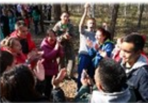
Преподавание иностранных языков: английский, корейский, испанский (в урочной и внеурочной деятельности)