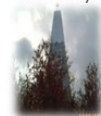
Обелиск А.С. Рыдзинскому