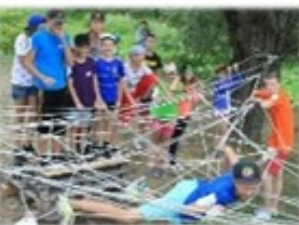
Занятия внеурочной деятельности «Экология», «Туризм», «Клуб Генералов Патриот»