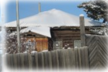
Дом-пятистенок, в котором впервые «поставили кинематограф», т.е. демонстрировали кино (еще немое)