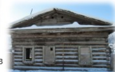
Магазин, где в 1922 году произошло собрание поселкового люда, когда в Табаге установили Советскую власть