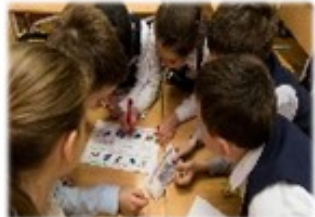
Фирменные классы с направлениями «Экология и туризм», «СМИ», «Международные отношения», «Агротехнология», «Политология»