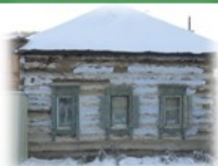
Здание школы 1886 г. постройки