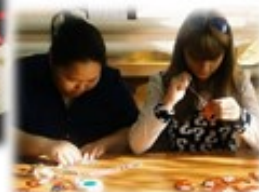
Кружковая работа: «Студия дизайна», «Уран Тарбах», «Мягкая игрушка», «Креативное рукоделие»