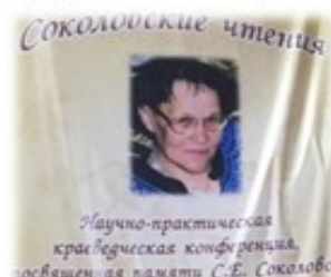
Научно-практическая конференция «Соколовские чтения»