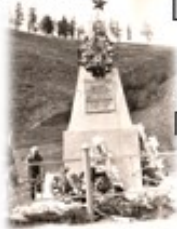
Памятник Н.А. Каландаришвили