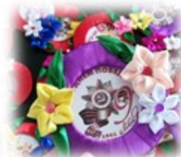
Школьная акция «Твори Добро»